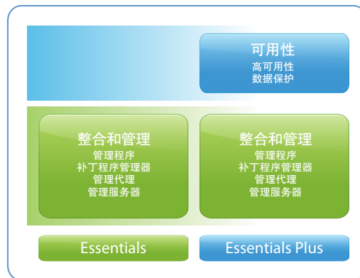
VMware vSphere Essentials 版

这两个版本都是一体式解决方案包，您可以将许多应用程序工作负载虚拟化和整合到运行 vSphere 的三个物理服务器上（每个物理服务器最多可有两个处理器），并通过 vCenter Server for Essentials 集中管理这些应用程序。 vSphere Essentials 包括为期一年的订购许可证。您可以选择按事件购买支持。 vSphere Essentials Plus 提供多种支持和订购 (SnS) 服务，需要单独购买。至少需要购买一年的 SnS。